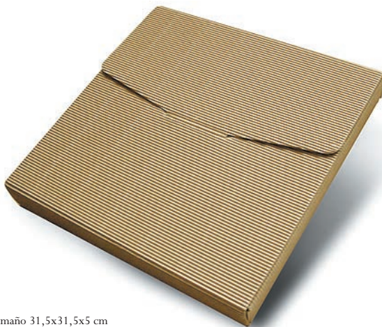
Cartón microondulado. Tamaño 31,5x31,5x5 cm

La edición dispone de cajas de protección para guardar la obra en biblioteca